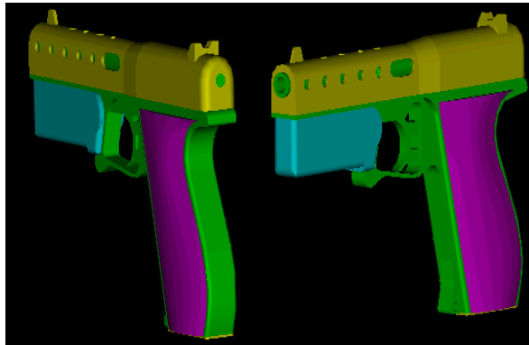
Şekil 3. Tasarlanan silahın 2 ve 3 Boyutlu resimleri.

Bu miktar bir enerjiyi sağlayabilecek itici yakıtın miktar ve hacmini bulalım. Bunun için öncelikle kullanılacak gazın belirlenmesi gerekir. Tablo 4.'de itici gaz olarak kullanılabilir çeşitli gazların ısıl enerji değerleri verilmiştir [5, 6, 7].